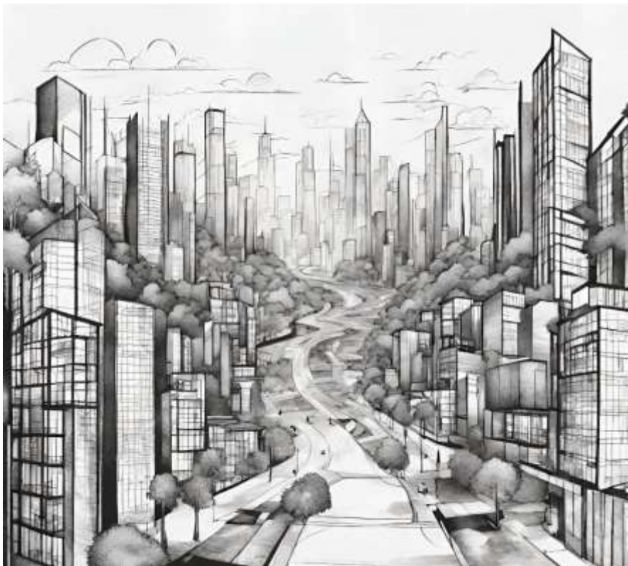
Imagen propia elaborada de una IA