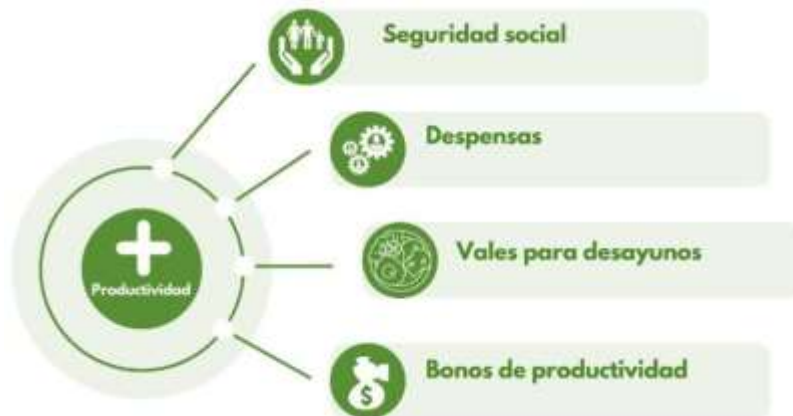
Ilustración 1: Factores por los que puede aumentar la productividad de los trabajadores del campo

En relación con la calidad de vida laboral, se planteó si su implementación es esencial para mejorar la productividad. La Lic. Miranda respondió afirmativamente, explicando que este concepto incluye seguridad en el empleo, remuneración adecuada, oportunidades laborales y recompensas. Estos factores motivan a los trabajadores, incrementan su satisfacción y, como resultado, aumentan su rendimiento y productividad.